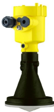
Souprava radarového snímače hladiny RSH-03